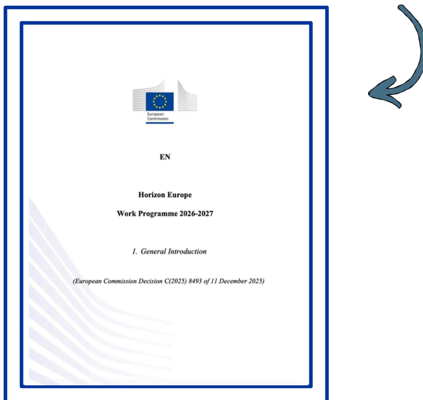
Figura 2: Model Program de lucru (Work Package)